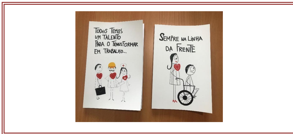
Livros N.º 7 "Tod@s temos um talento para o transformar em trabalho" e N.º 8 "Sempre na linha da frente"