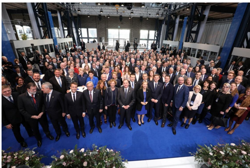
Participantes na Cimeira Social

As principais mensagens apresentadas pela Delegação da Plataforma Social foram as seguintes: