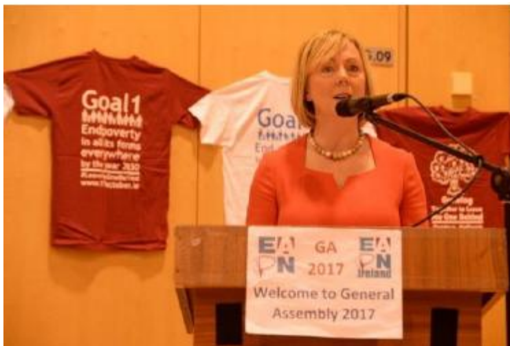
Ministra do Emprego e da Proteção Social da Irlanda

necessidades das pessoas, da situação frágil das crianças e do compromisso de trabalho em parceria que deve existir entre entidades governativas e o sector não-governamental.