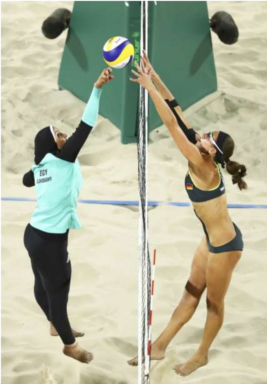
IMAGEM DOS JOGOS OLIMPICOS NO BRASIL EM 2016